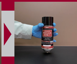
透明キャップを取り、鉄心を石やコンクリートで最後まで押し込む。