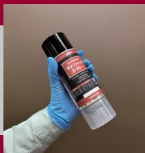
容器を上下によく振る。