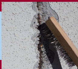
付着力のない浮きび、被塗部の塩分・油脂・塵埃・水分などを除去